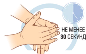
4. ВНИМАТЕЛЬНО ЧИТАЙТЕ ИНСТРУКЦИЮ НЕ МЕНЕЕ 30 СЕКУНД