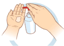
2. НЕТ ВОЗМОЖНОСТИ ПОМЫТЬ РУКИ, ИСПОЛЬЗУЙТЕ КОЖНЫЕ АНТИСЕПТИКИ