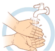
1. ЧАЩЕ МОЙТЕ РУКИ

Косметические средства не обладают должным антисептическим эффектом и не могут эффективно защитить от вирусов и бактерий.